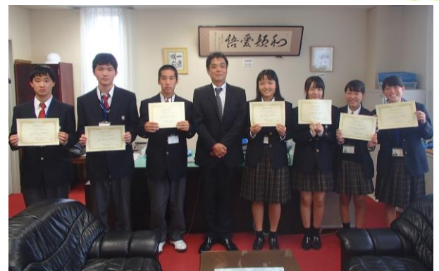
(写真は就業体験学習に参加した笠田高等学校の皆さん)

7 名の高校生が考えたクイズは、実際にクイズを解いた小学生から「面白くて、また税金クイズを解きたい」と好評でした。